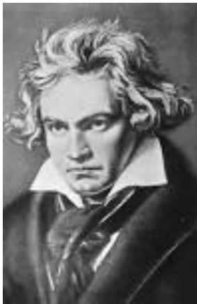
Ludwig van Beethoven